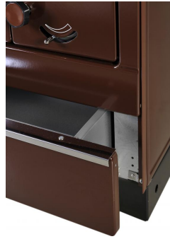
THORMA OKONOM 85 FIKO De Luxe - Levý