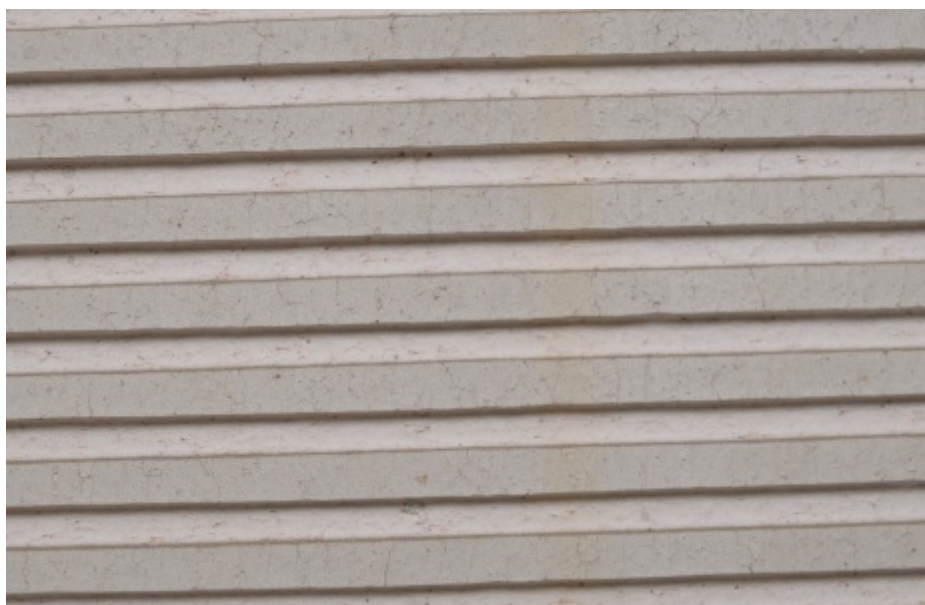
Póry působí v šamotu jako přirozený tlumič šíření napětí a jsou schopny ukončit narůstající trhlinu. Velikost