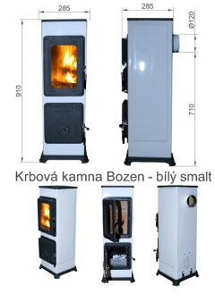
Krbová kamna Bozen - bílý smalt