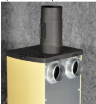
Připojení na komín a rozvod teplovzdušného topení