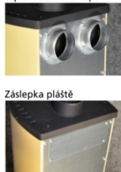
Napojení na rozvod teplovzdušného topení