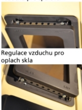
Regulace sekundárního vzduchu pro spalování