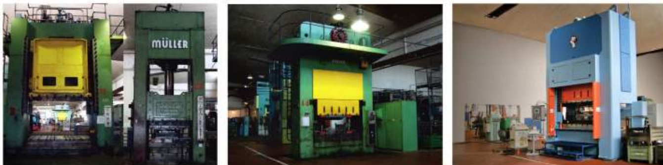
Lisování - stříhání a hohybání, hluboké tažení a protlačování