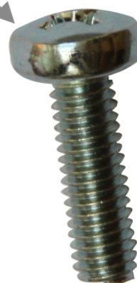
Šroub pro kličku 592.0000000610