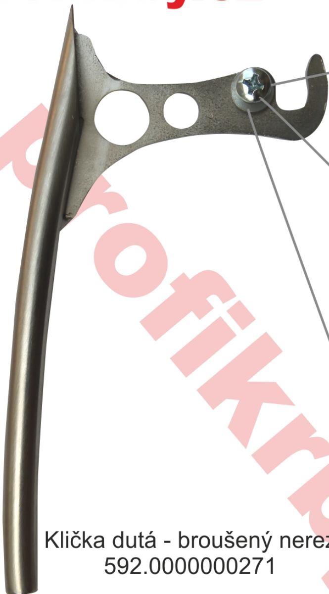
Klička dutá - broušený nerez 592.0000000271