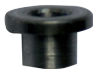
Podložka pro kličku s osazením 592.0000000565