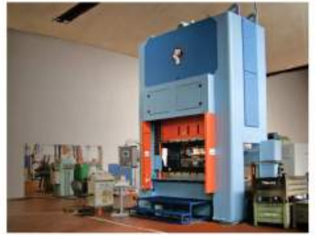
Lisování - stříhání a hohybání, hluboké tažení a protlačování