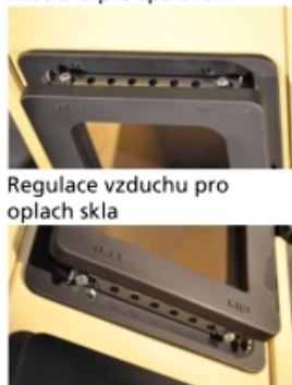
Regulace sekundárního vzduchu pro spalování