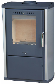
KRBOVÁ KAMNA COLMAR