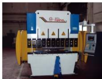
Řezání laserem, vysekávání, ohrabování