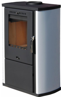
KRBOVÁ KAMNA COLMAR