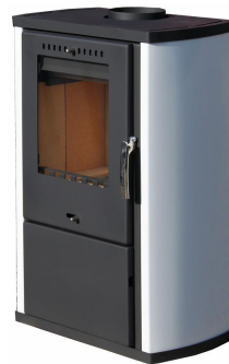
KRBOVÁ KAMNA COLMAR