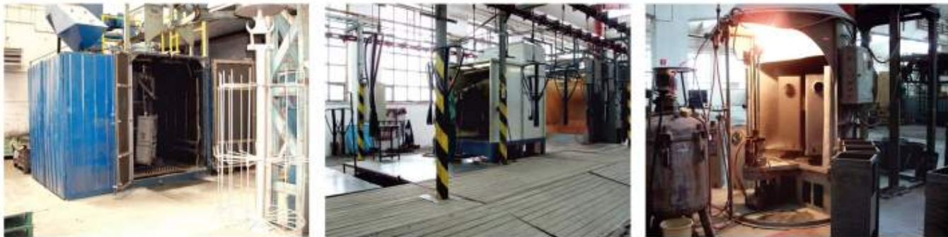
Pískování povrchu, galvanické pokovování a smaltování