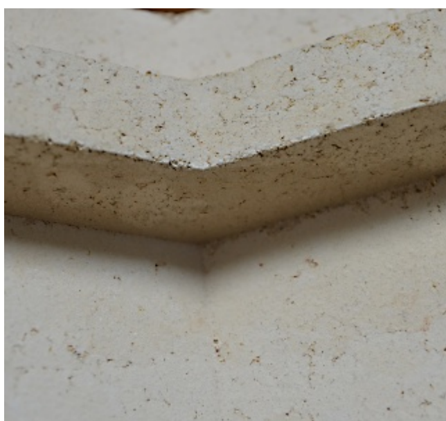
Omítací akumulční šamotové tvarovky AKUMOL