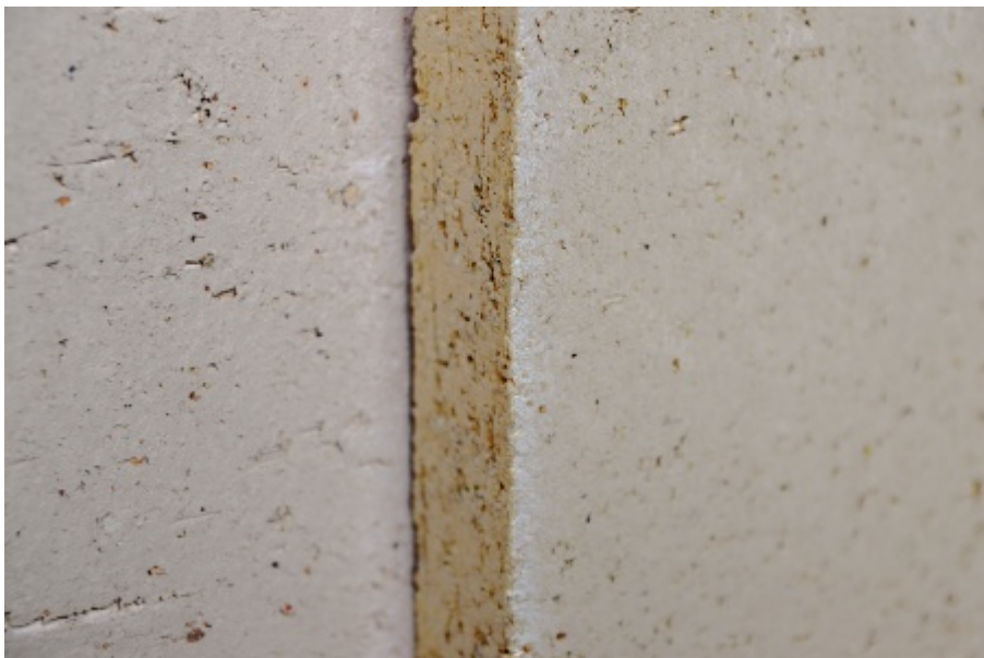
Lisované šamotové tvarovky