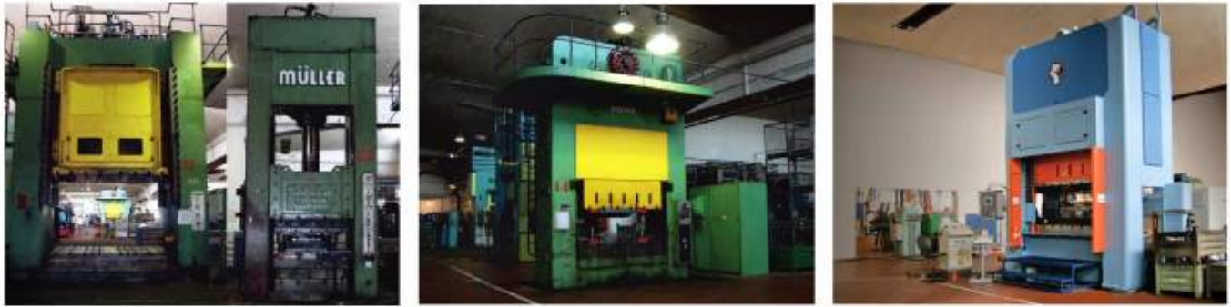
Lisování - stříhání a hohybání, hluboké tažení a protlačování